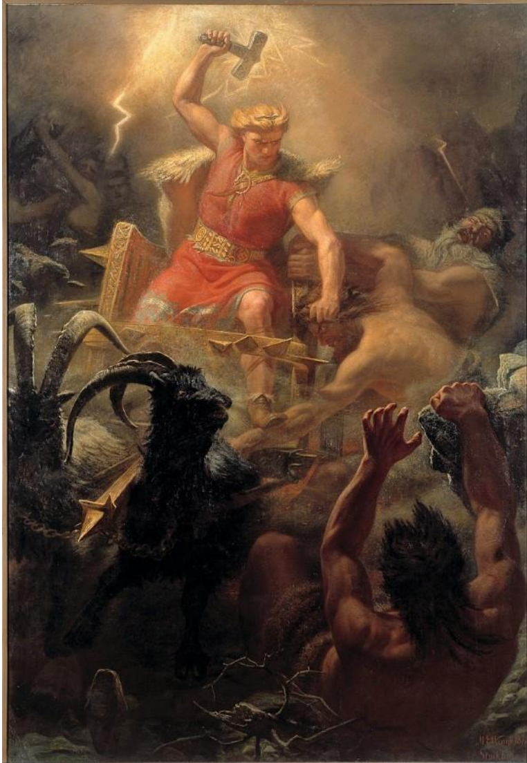
Mårten Eskil Winge/Publiek Domein

troeven. Als kind was hij al een opvliegend baasje, maar de god had het hart op de juiste plaats. Hij was recht voor z'n raap en je wist altijd wat je aan hem had.